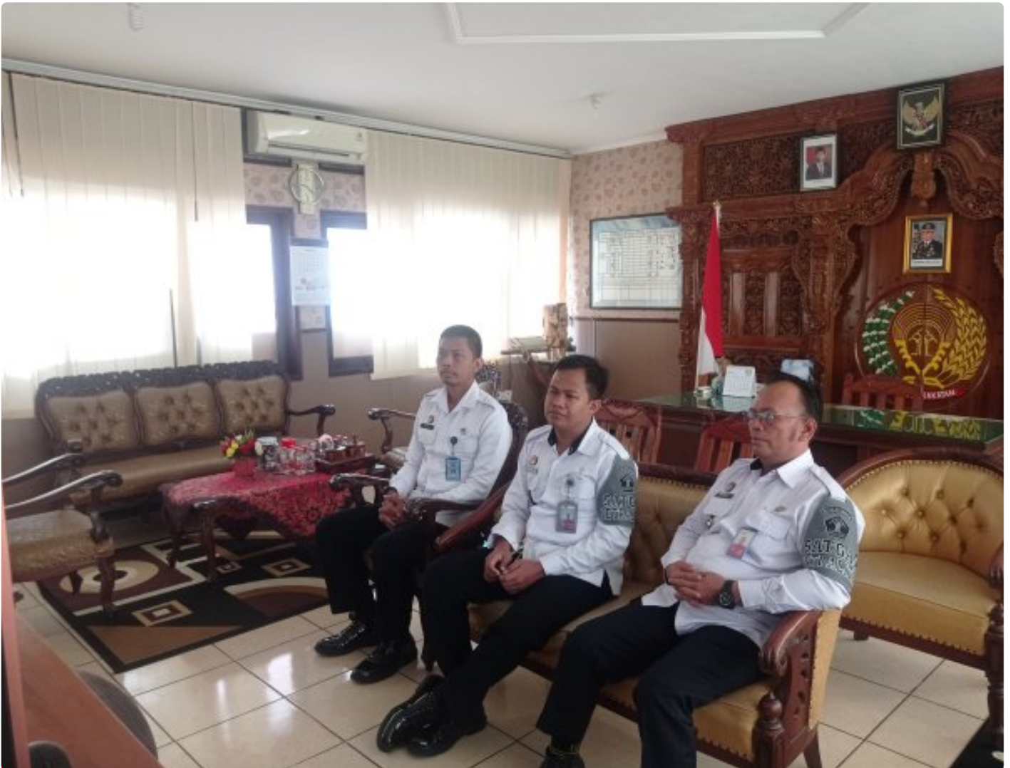
Rutan Blora Bergabung Dalam Giat Zoom Reformasi Birokrasi

Blora - Reformasi birokrasi merupakan sebuah kebutuhan yang perlu dipenuhi dalam rangka memastikan terciptanya perbaikan tata kelola pemerintahan, serta